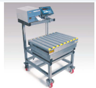
Piattaforma monocella con rulliera. Indicatore collegato ad etichettatrice. Carrello con piano rialzato.