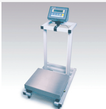
Piattaforma su carrello con indicatore fissato sul manubrio.